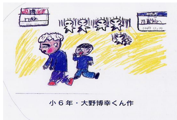
小6年・大野博幸くん作